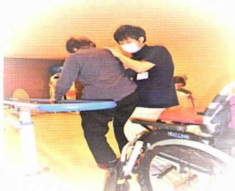
作業療法士によるリハビリ