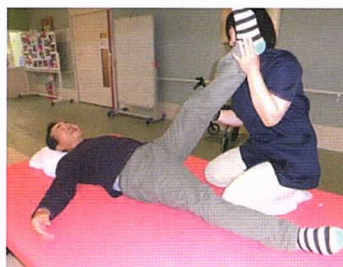
理学療法士によるリハビリ