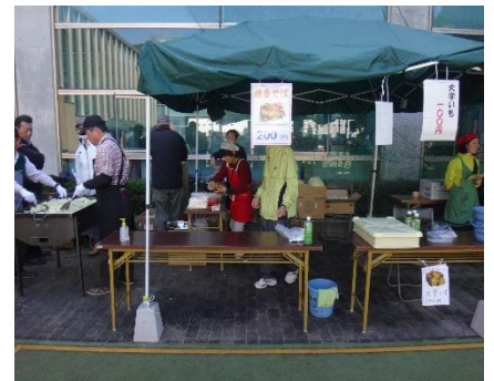
焼きそば、できたかな？