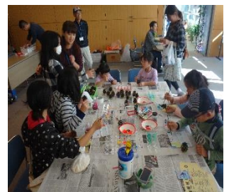
きれいに色付け、松ブロック