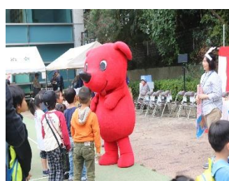
チーバくんとじゃんけん