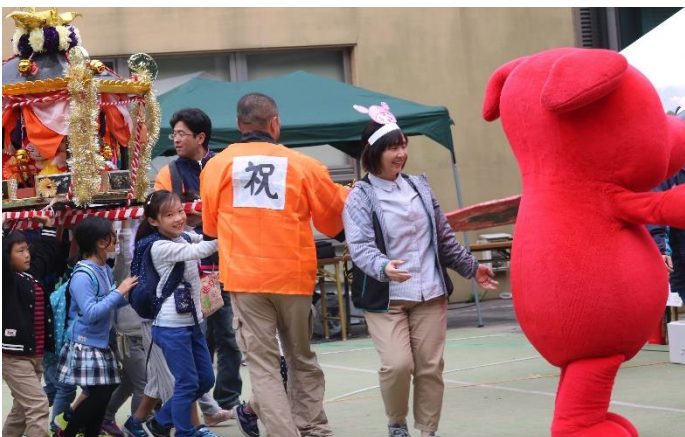
チーバくんと一緒に、みこしだ、わっしょい！