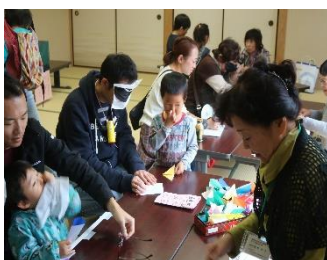
目隠しで、よく見えないね