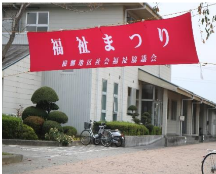
曇りだけど、なんとか大丈夫

また 根郷地区社協の模擬店、参加団体のバザーも開店し、行列の絶えないお店もありました。大抽選会が終盤にさしかかった頃雨が降り始め、雨の中の「閉会」となりましたが日中は雨もなく予定通り終えることができました。