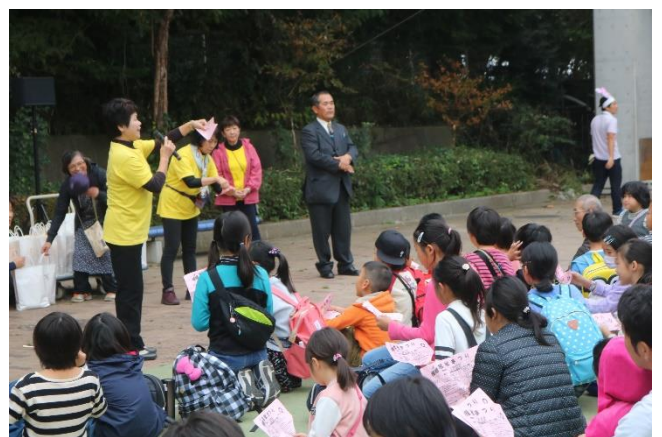
待ってました、大抽選会 何があたるかな？