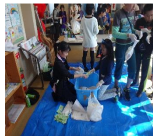
お米、すくえるかな？