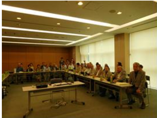
常盤平地区社協の皆様

9時50分盛況のうちに終了となり、常盤平地区社協の皆様はバスにて次の訪問地に向かわれました。