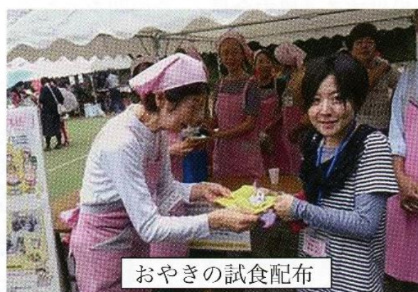
おやきの試食配布