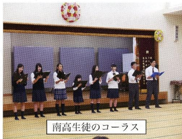
南高生徒のコーラス