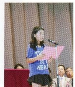
根郷・寺崎・山王小学校生徒さんの敬老の作文披露と贈呈