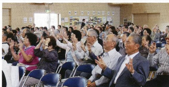
息を合わせて イチ・ニツ・サン