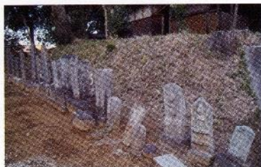
玉蔵院境内石碑 (庚申塔・秩父講)