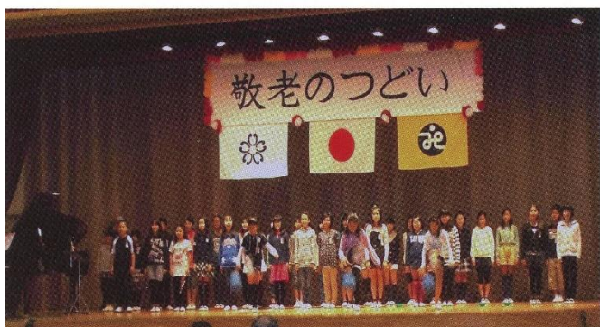
根郷小児童による合唱

ご来場の方からは「初めて参加したが楽しかった」「旧友に再会できてうれしかった」等の感想が寄せられていました。