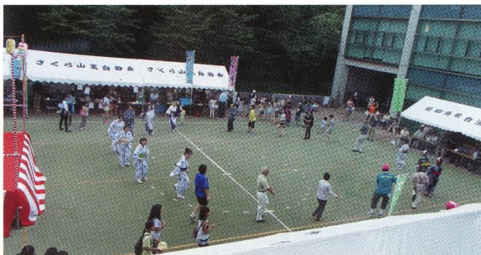
みんな輪になって楽しく盆おどり