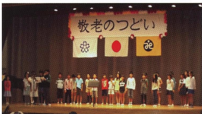
山王小児童による合唱