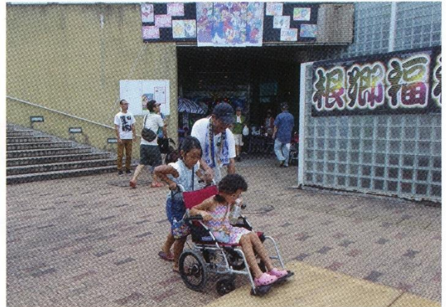
車いすの使用体験 段差を慎重にのぼります。