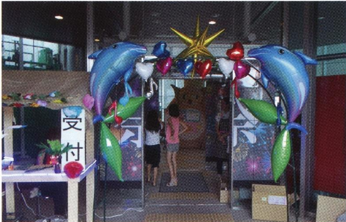
きれいに飾り付けられ、来場者を迎える準備のできた玄関

中庭での地域の皆様の演芸、模擬店、研修室でのネイルサロンやストラックアウト、米すくいなどに楽しい時間を過ごしました。