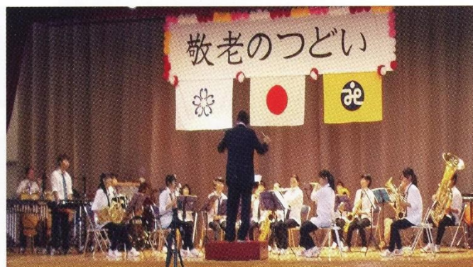
根郷中生徒による吹奏楽演奏