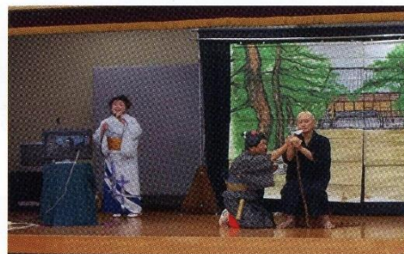
10月3日「栄ちゃん一座」出演