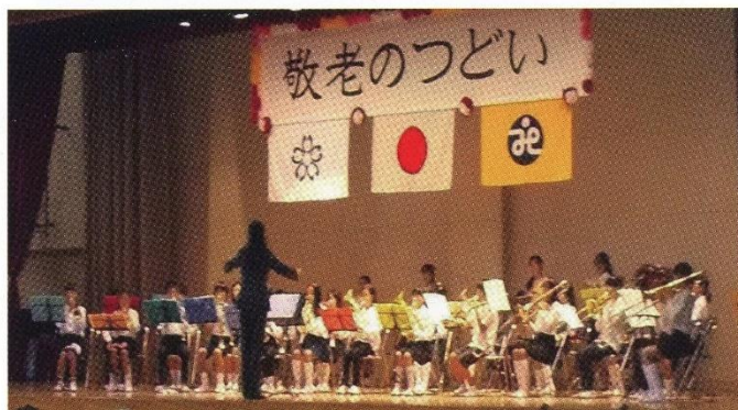
寺崎小児童による合唱・合奏