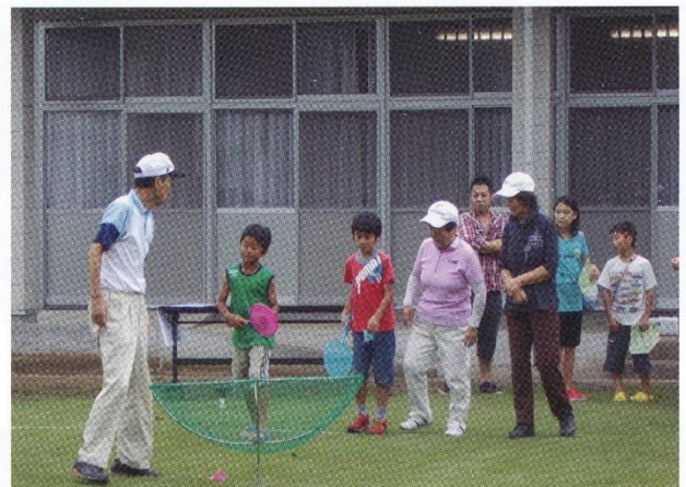
ターゲットバードゴルフ どうすればいいの・・・