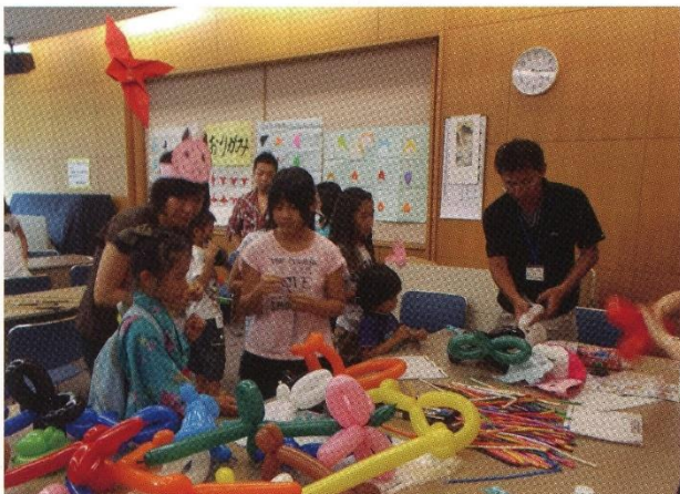
アートバルーン・・・何をつくろうか