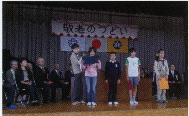
地域の3小学校児童の心のこもる作文朗読