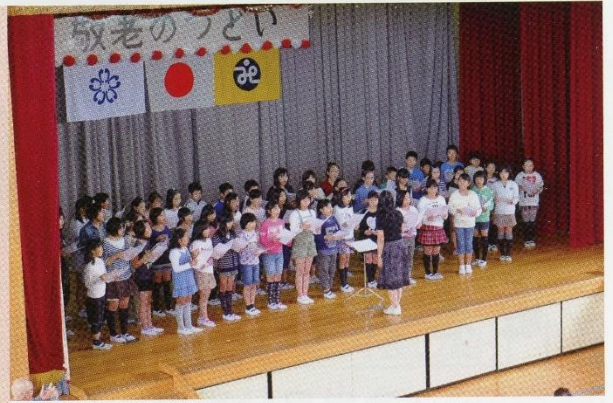
根郷小児童による合唱