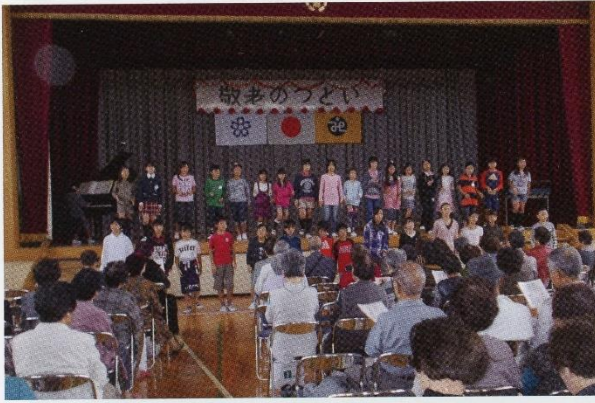
山王小児童による合唱

(1面から続く) 敬老のつどいでは、小中学生が日頃の感謝を歌と演奏で表現してくれました。