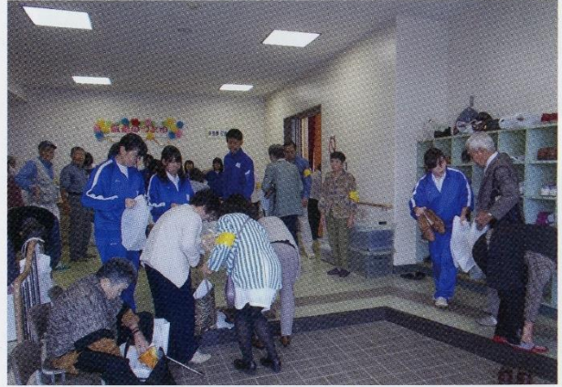
南部中・根郷中・佐倉中3中学生のボランティアに迎えられ「こんにちは」