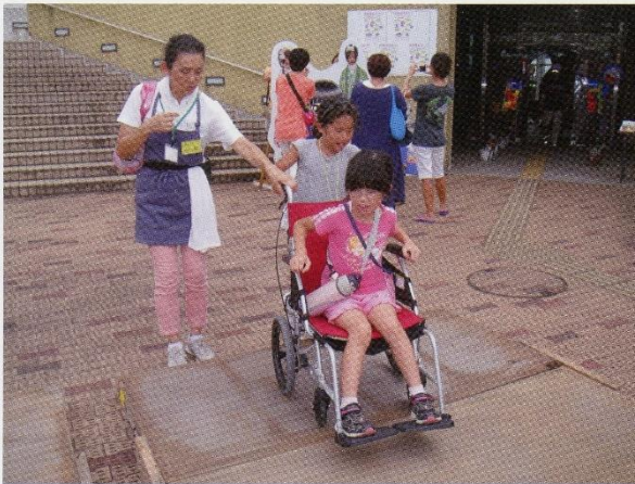
はい、ゆつくり 気をつけてね