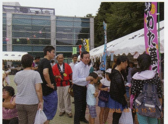
にぎわう模擬店 市長も「何にしようかな？」