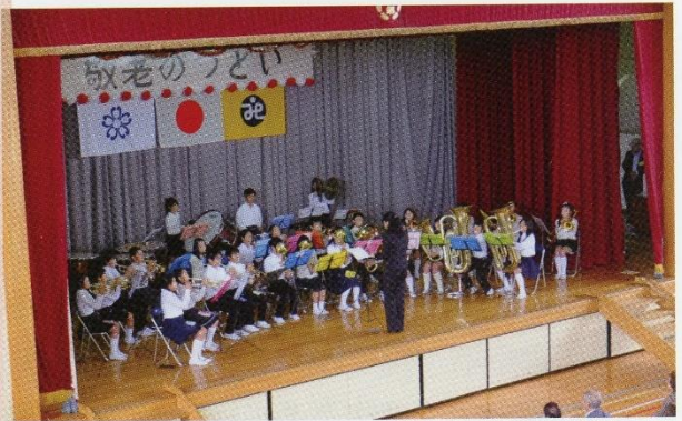
根郷中学生による吹奏楽演奏