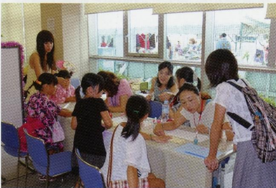
「ネイルアートしましょ」 きれいな手にうっとり