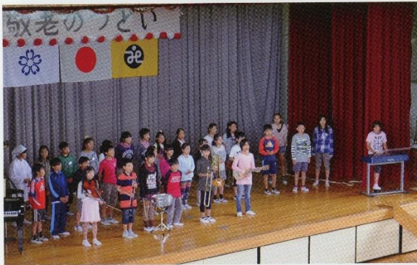
寺崎小児童による合唱・合奏