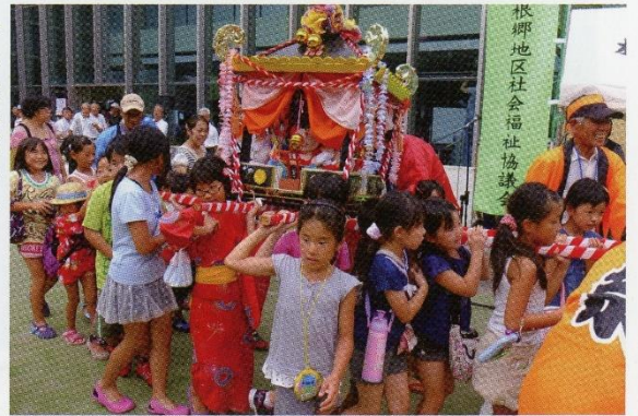
みんな元気に ワッショイ！ワッショイ！